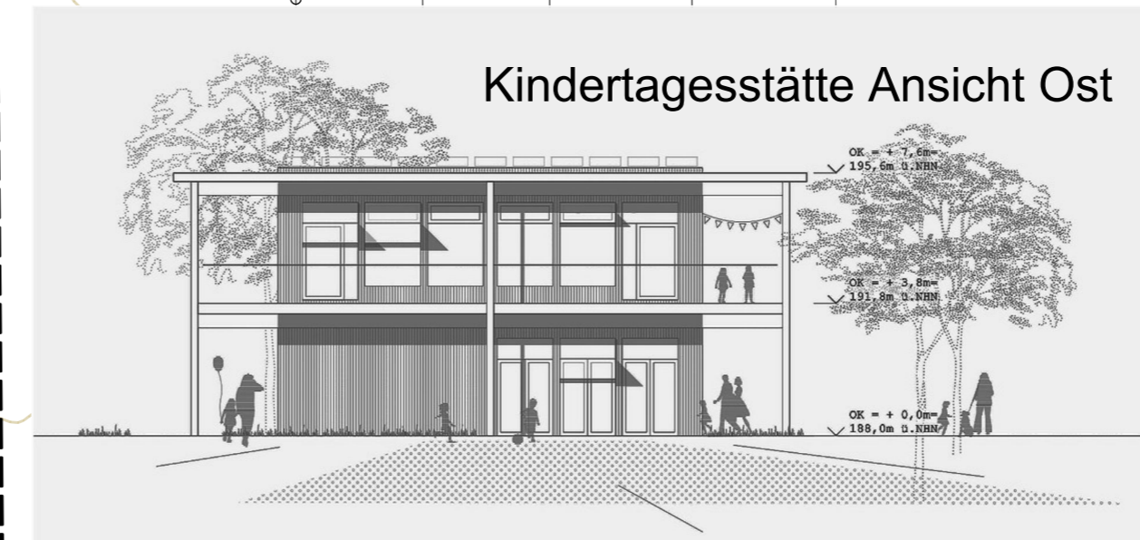
Kindertagesstätte Ansicht Ost