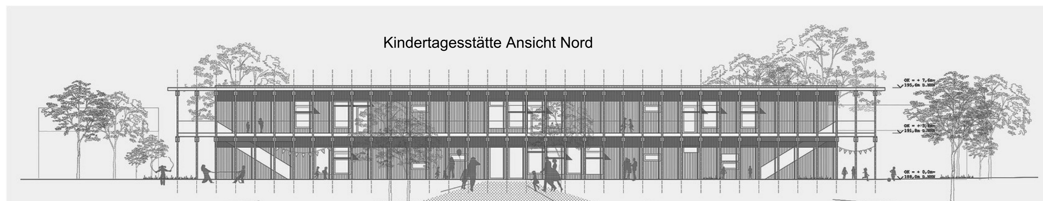
Kindertagesstätte Ansicht Nord