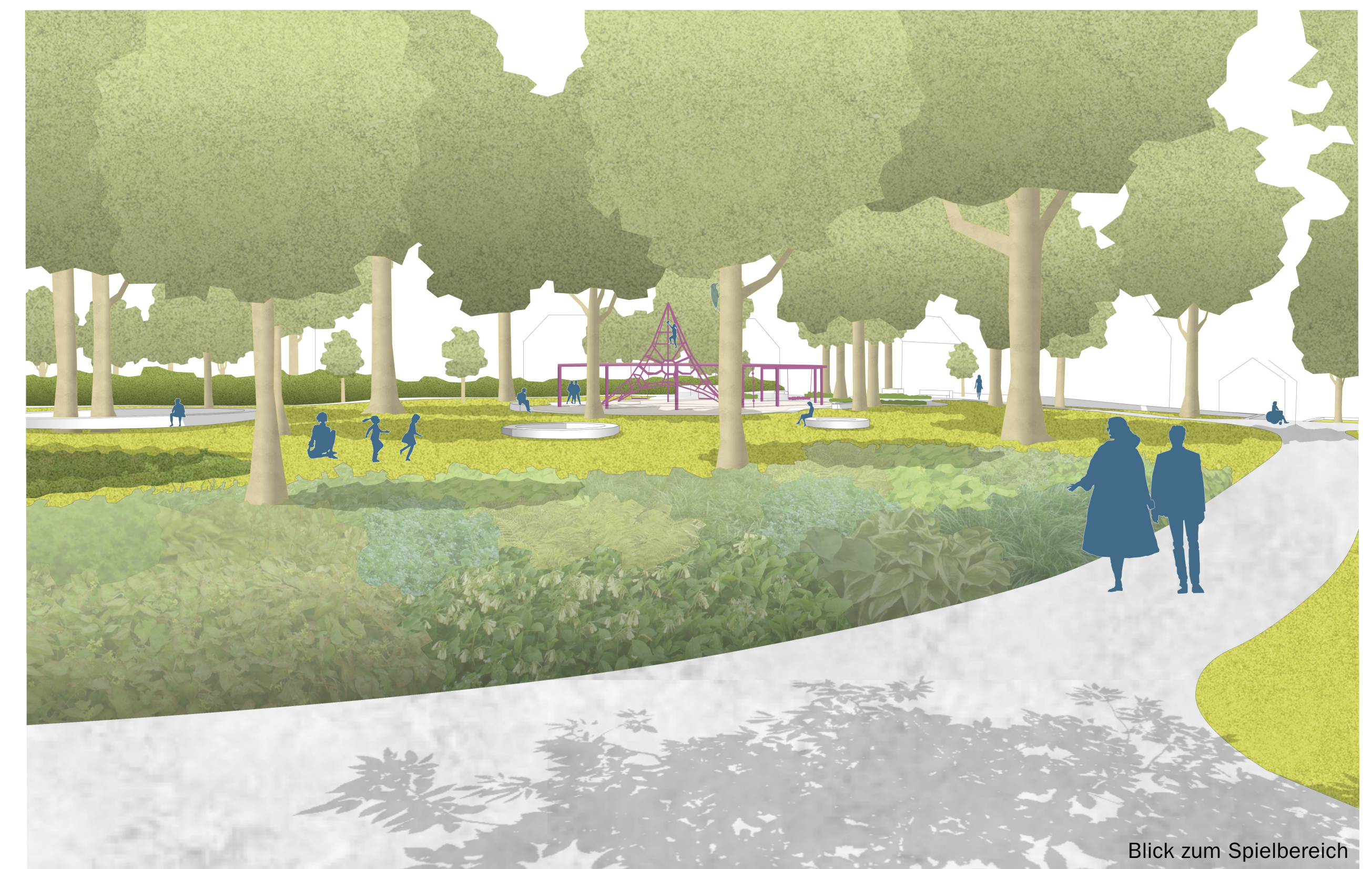
Blick zum Spielbereich

SPIELBEREICH Der im Park bereits richtig vertortete Spielbereich wird durch die Neugestaltung für alle Altersklassen aufgewertet. Wie einzelne Trauben ergeben die funktional unterschiedlich bespielten Teilflächen ein Ganzes. Betritt man den Alten Friedhof im Nord-Westen von der Blumhardtstraße über die Treppe so wird man über einen offenen Platz willkommen heißen. Räder und Scooter können hier abgestellt werden. Ein Trinkbrunnen ist ebenfalls vorgesehen. In unmittelbarer Nähe sind Tischtennisplatten und eine Lümmellecke zu finden. Der Sand-Matsch-Bereich mit Wasseraufzug zum „Stauen und Fließen“ wird über eine manuelle Wasserpumpe gespeist. Eine Rutsche erweitert das Spielangebot in diesem Kreis. Dem gegenüber liegt der Sand-Matsch-Bereich für die Kleineren mit Matschschüssel, Wasserpumpe und Sandelpodest , die mit dem Rollstuhl ebenfalls anfahrbar sind. In der Mitte wird der beliebte Selzikus erhalten und additiv mit einem Spielband ergänzt. Das über Kopf geschwungene Spielband aus Rundstahl in Farbe erweitert mit angehängten Seilen, Sitzellern, Tauen und Griffen das Kletterangebot und fördert spielerisch die Motorik. Das Band endet mit Schaukeln , die zum gemeinsamen Schaukeln mit Blick in den Park einladen. Alle Spielreize sind über den außen anliegenden Pflasterbelag zugänglich. Auch finden sich Sitzgelegenheiten am Rand oder Picknickbänke in der Mitte wieder.