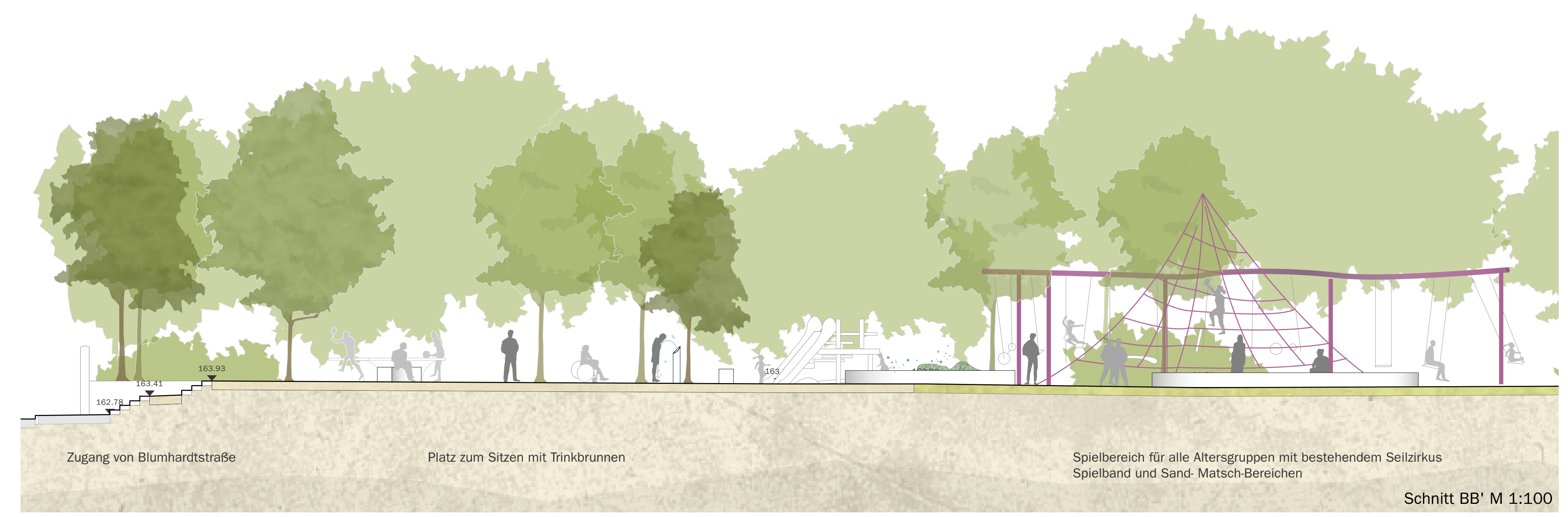
Schnitt BB' M 1:100