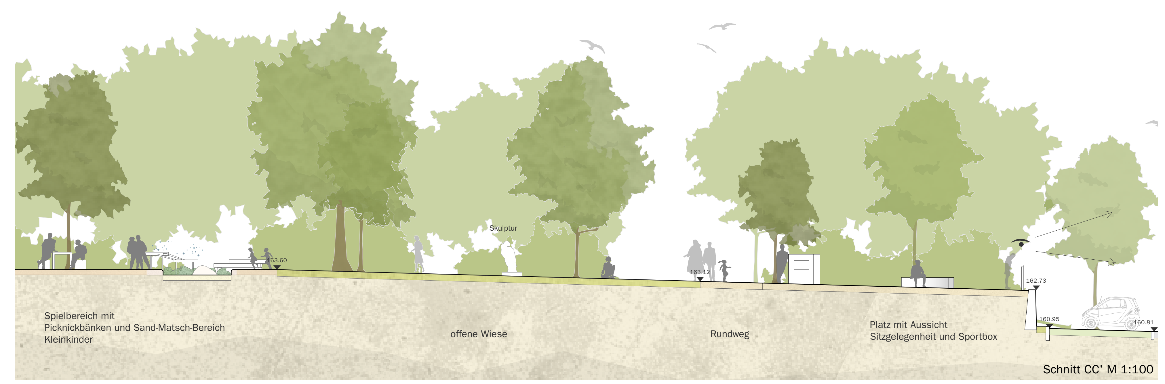
Schnitt CC' M 1:100