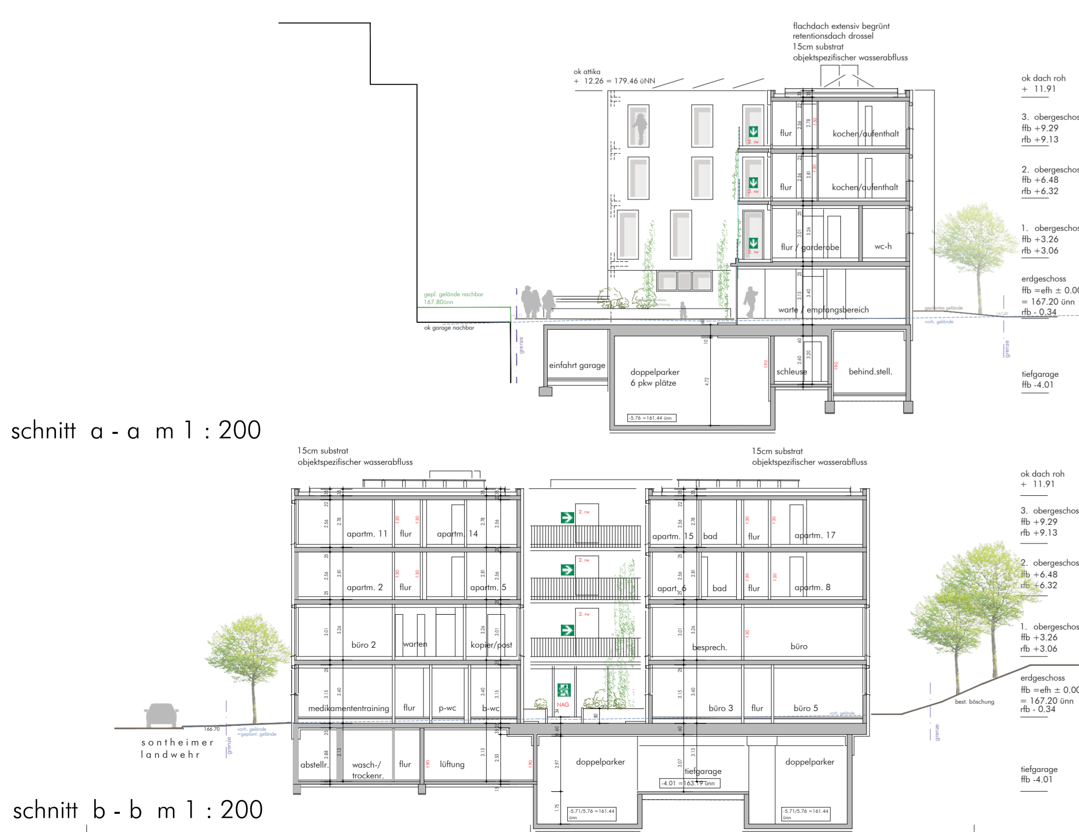
schnitt a-a m 1 : 200

Neubau für das Therapeutikum Heilbronn Flst.Nr. 3364 u. 3365 Vorhabenträger Rolf Klink Mäcker Straße 32 74074 Heilbronn BENTIA Immobilien GmbH + Co. KG Dr. Wolfgang Bleichschmitt Frankfurter Straße 16/2 74072 Heilbronn Entwurf und Planung BARTH+PARTNER 4888 AK-STRASSE 804 FAKTO WEBB WELLS BRACK D-72372 ESSLINGEN 07141/923846 0 FAX 0711/923846 30 www.barth-architekten.com Geliefert, den 18.07.2025 gez. Werner Berth, freier Architekt BDA gez. Heilbronn, den Vermessungs- und Katasteramt