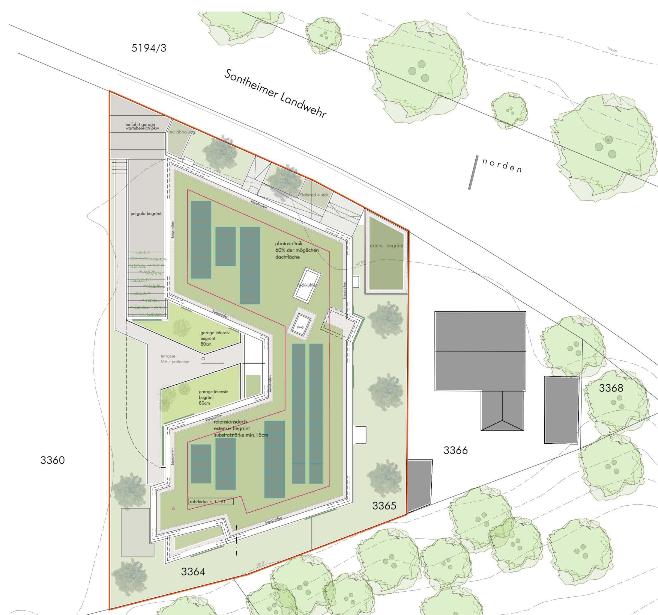
dachansicht / freiflächengestaltungsplan m 1 : 200