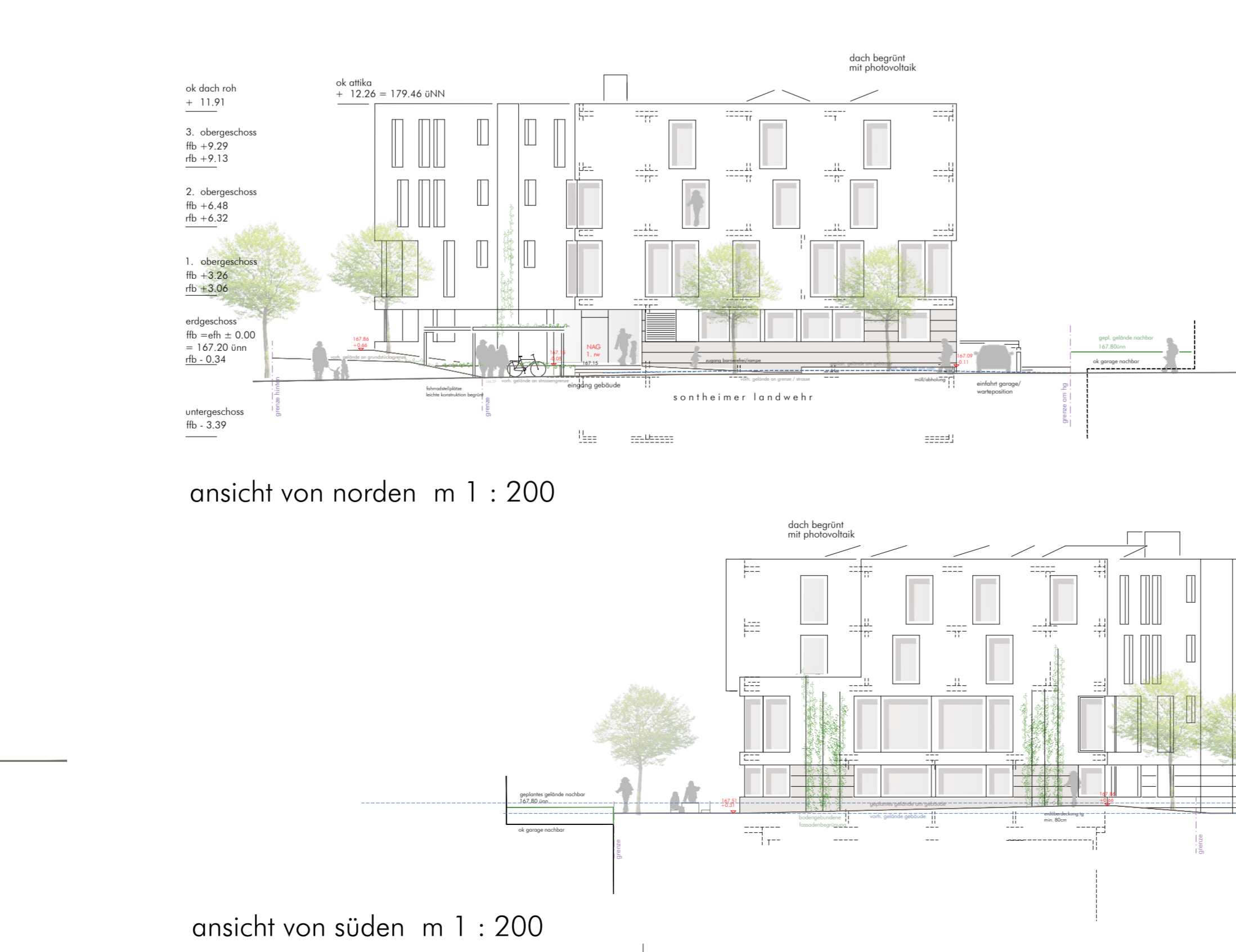
ansicht von norden m 1 : 200