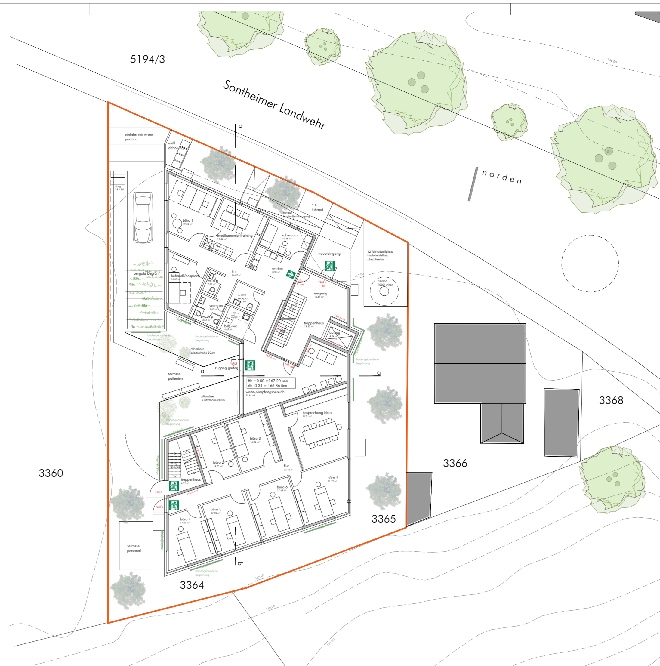
erdgeschoss m 1 : 200