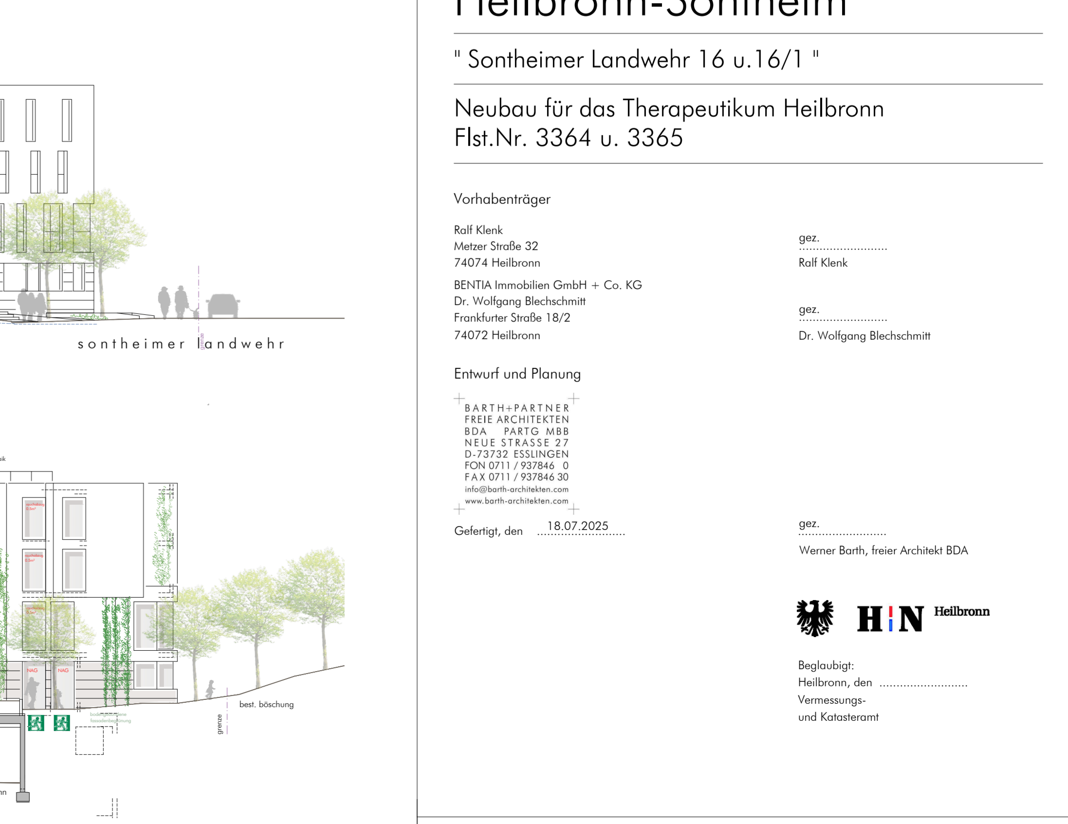
ansicht von westen m 1 : 200