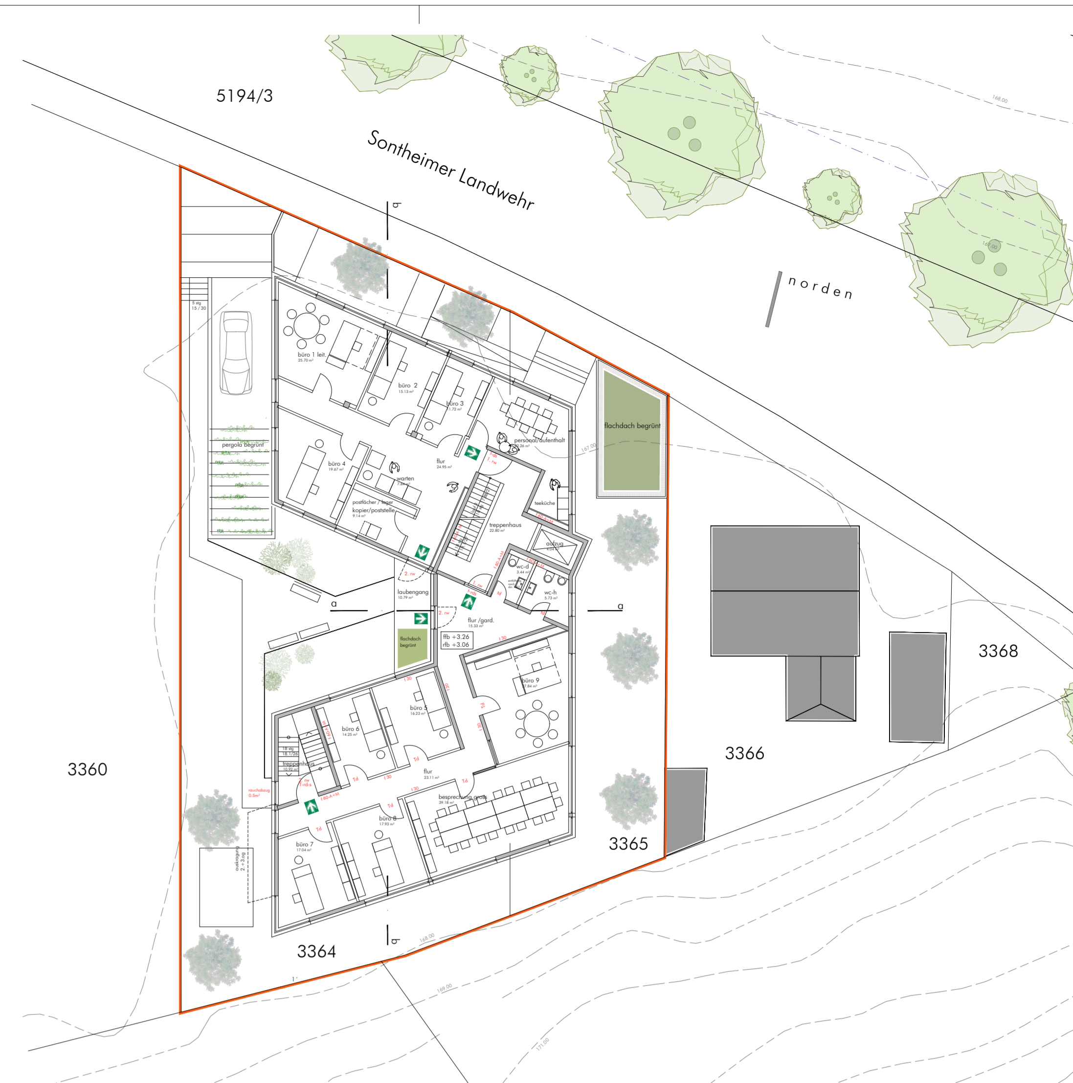
1. obergeschoss m 1 : 200