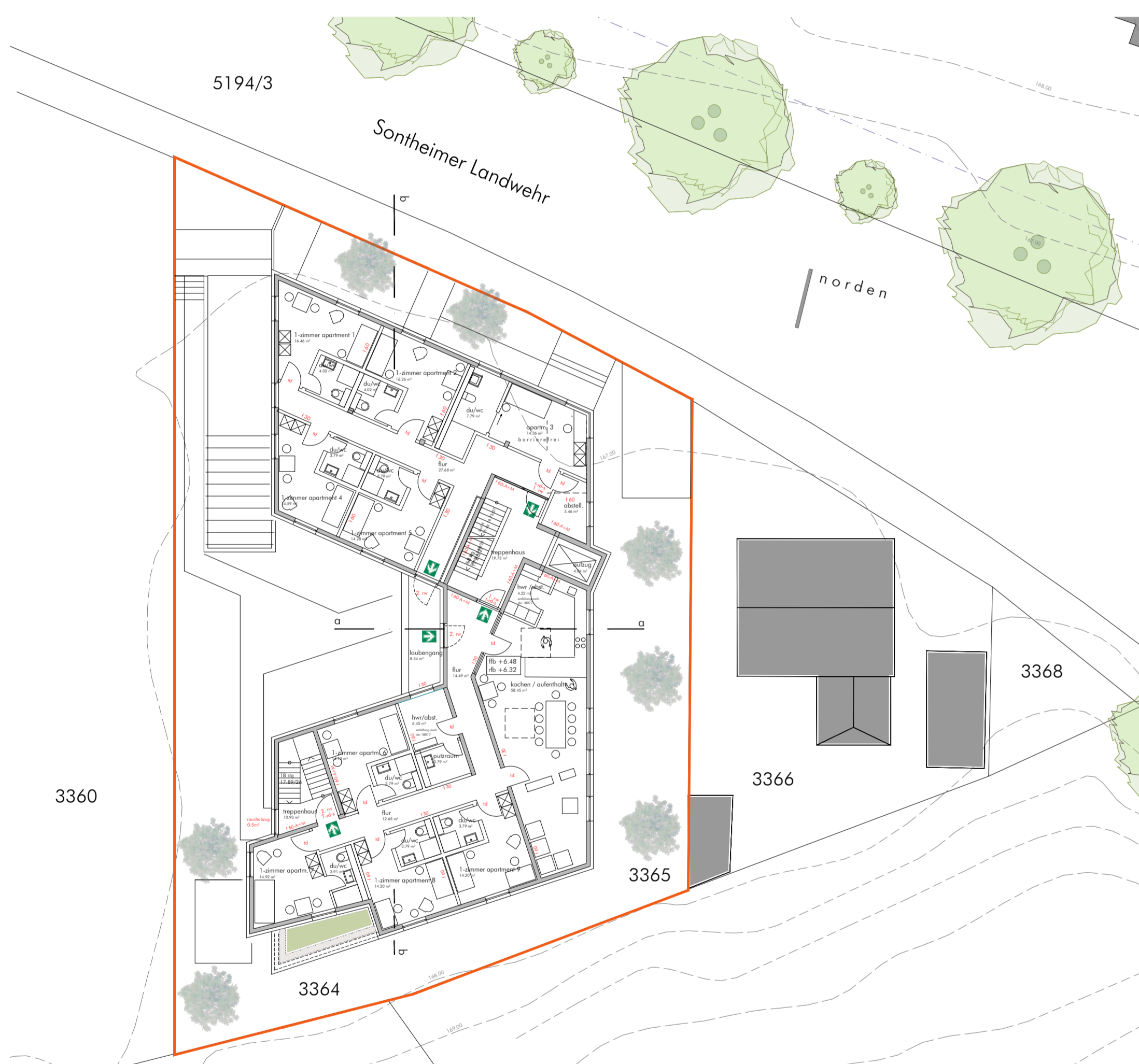
2. obergeschoss m 1 : 200