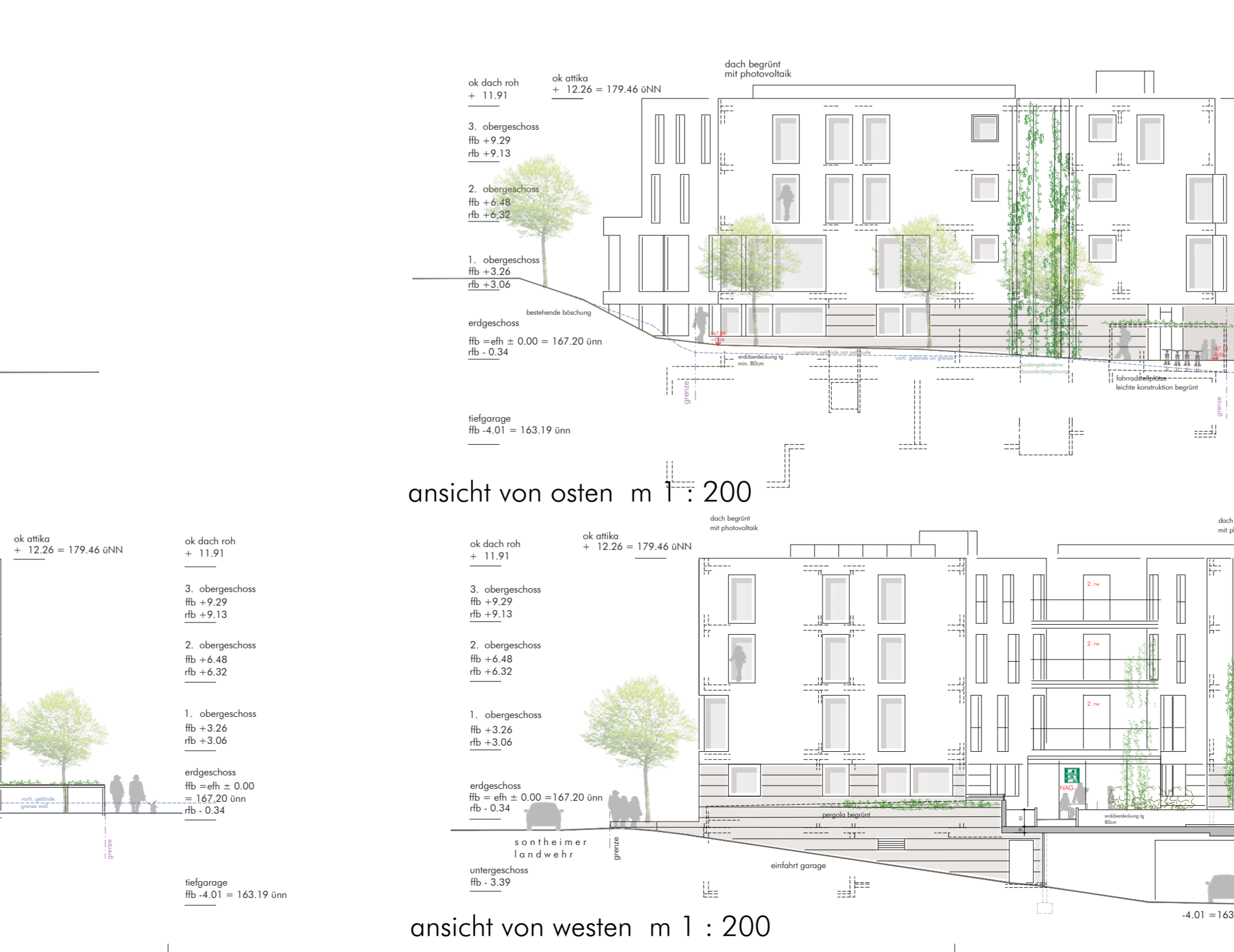
ansicht von osten m 1 : 200