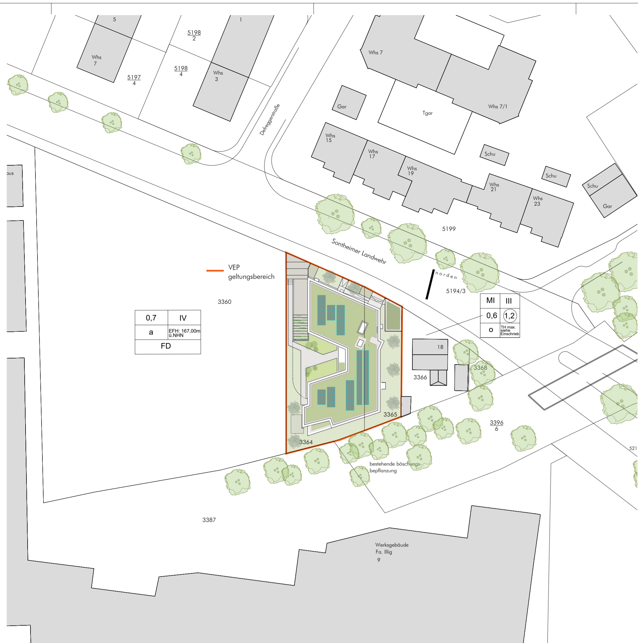
lageplan m 1 : 500