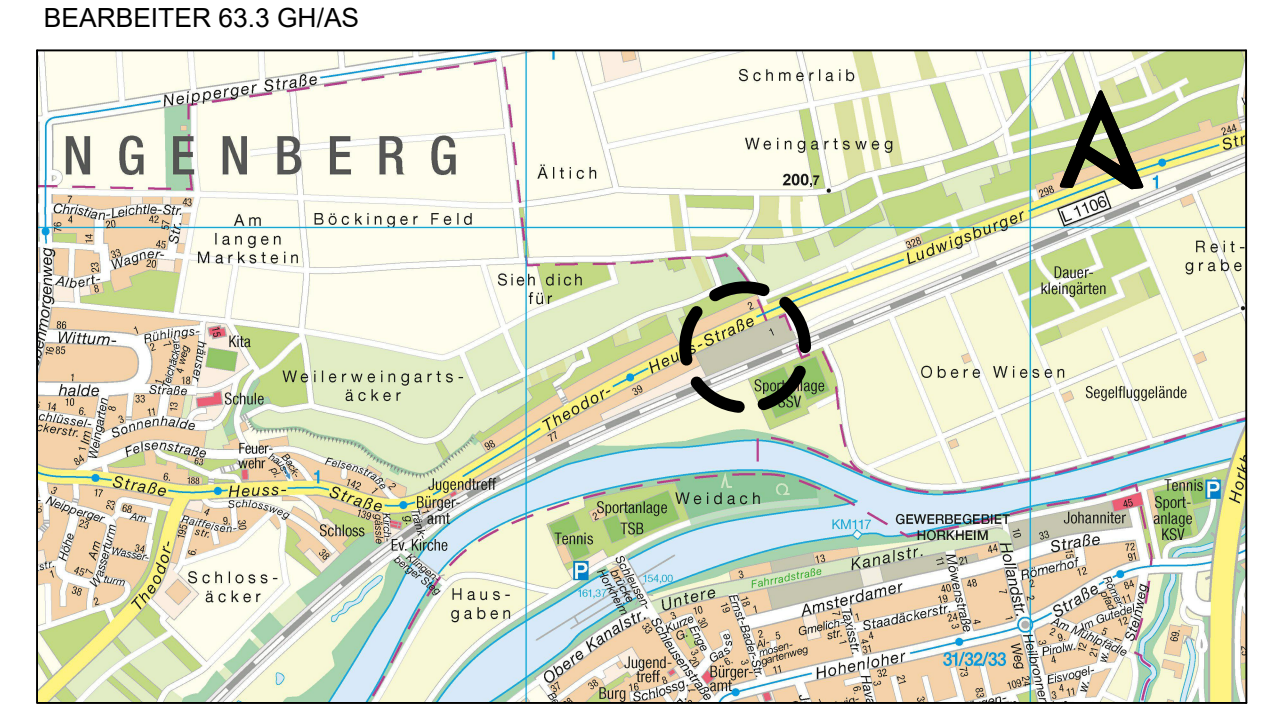
Kartgrundlage: Vermessungs- und Katasteramt