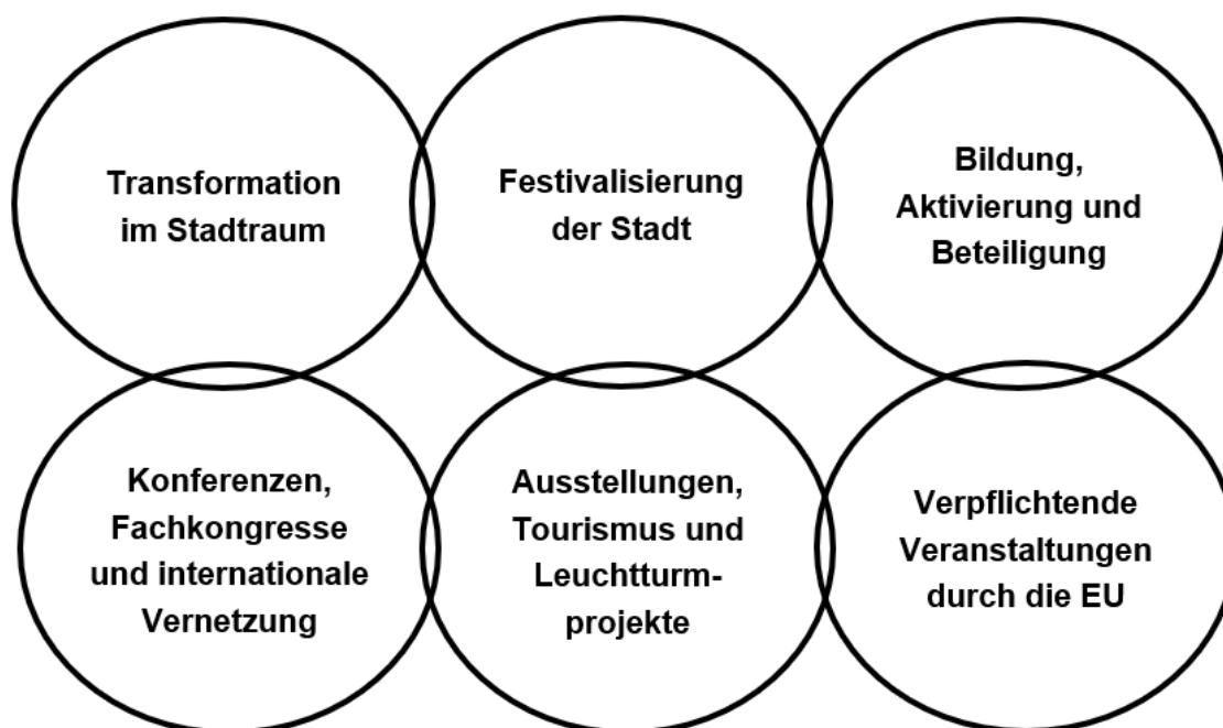
Abb. 1: Zentrale Schwerpunkte des Jahres

Im Folgenden werden die zentralen Schwerpunkte des Jahresprogramms mit ausgewählten Aktivitäten und Projekten beschrieben. Details dazu sind in den Projektsteckbriefen (Anlage 1) dargestellt, diese enthalten auch die jeweiligen Kosten. Die Nummern in Klammern verweisen auf diese Steckbriefe. Für Projekte ohne Steckbrief sind Buchstaben vergeben, die auf Anlage 2 verweisen. Darüber hinaus werden beispielhaft Projekte von Partnern aufgeführt, die keine zusätzlichen Kosten für den städtischen Haushalt verursachen.