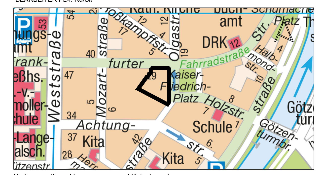
Kartengrundlage: Vermessungs- und Katasteramt

M 1:500 BEARBEITER PL-I: Ru/Sk 0 5m 10m 20m 30m 50m