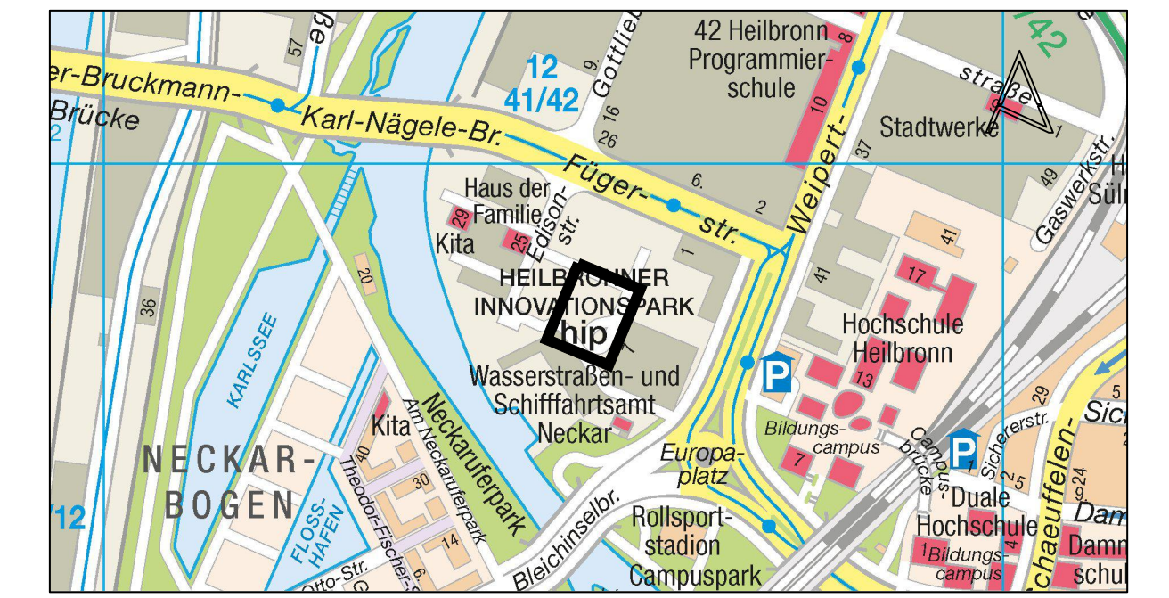
Kartgrundlage: Vermessungs- und Katasteramt